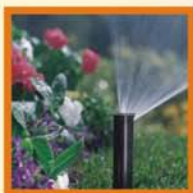
Pop Up statici e a turbina Static and gear pop up sprinklers Tuyères statiques et à turbine Pop up estáticos y a turbina