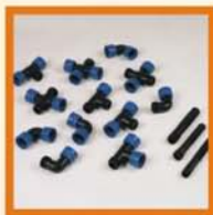
Collettori modulari Modular Manifolds Raccords à écrous tournants Colectores modulares