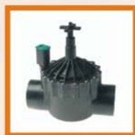
Elettrovalvole Electric valves Vannes de controle Electro-válvulas