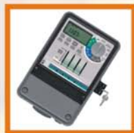
Centraline Water timers Programmateurs d'irrigation Programadores de riego