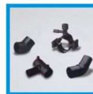
Raccordi in PEAD HDPE fittings Raccords de PEHD Juntas de PEAD