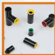
Raccordi svelto Pn6 Pn6 quick-joint fittings Joints rapides PN 6 Juntas rápidas Pn6