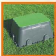
Pozzetti Valve Boxes Regardes Arquetas