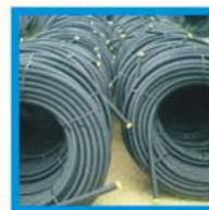
Tubi in PE PE pipes Tuyaux de PE Tubería de PE